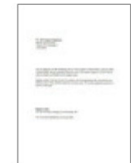
#1 ข้อความสีดำ

*1 ความเร็วการพิมพ์ (หน้าต่อนาที) คำนวณจากการพิมพ์บนกระดาษธรรมดา A4 ในโหมดที่เร็วที่สุด ความเร็วในการพิมพ์อาจแตกต่างกันไปขึ้นอยู่กับข้อกำหนดค่าของระบบ, โหมดการพิมพ์, ความซับซ้อนของเอกสาร, ซอฟต์แวร์, ประเภทของกระดาษที่ใช้ และการเชื่อมต่อ ความเร็วในการพิมพ์โดยรวมเวลาประมวลผลของคอมพิวเตอร์เครื่องที่สั่งพิมพ์